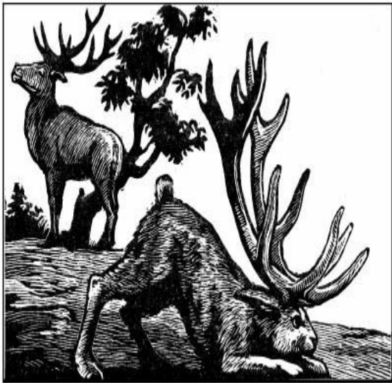
biǎn jiǎo lù hé xiǎo lù 扁角鹿和小鹿