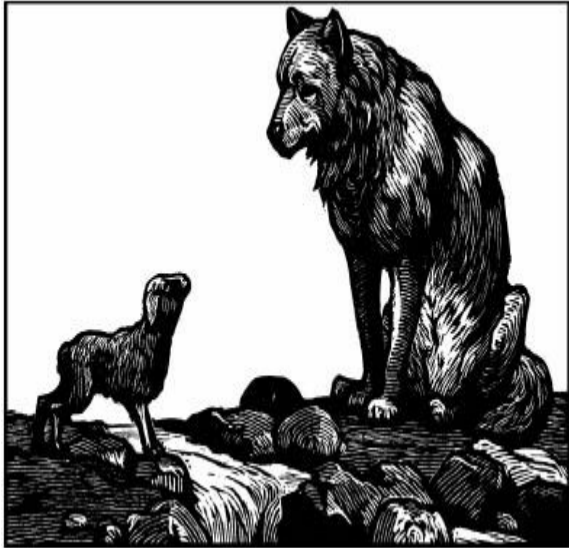
láng hé xiǎo mián yáng 狼和小绵羊