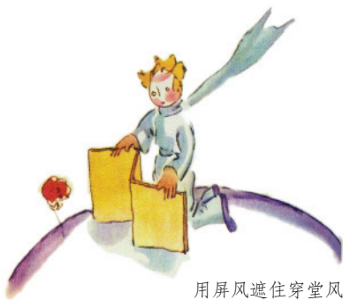
用屏风遮住穿堂风